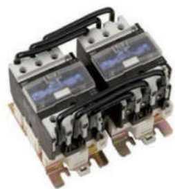
SZRC1N系列可逆交流接触器